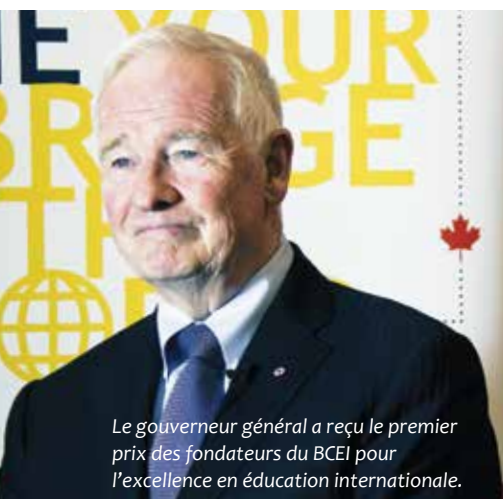
Le gouverneur général a reçu le premier prix des fondateurs du BCEI pour l'excellence en éducation internationale.