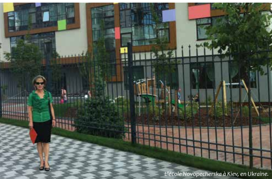
L'école Novopecherska à Kiev, en Ukraine.