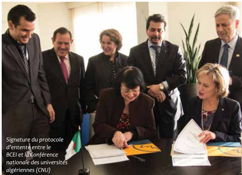
Signature du protocole d'entente entre le BCEI et la Conférence nationale des universités algériennes (CNU)